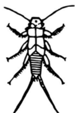
Larva de perla