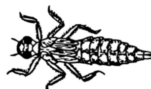
Larva de libèl·lula