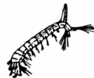
Larva de mosquit