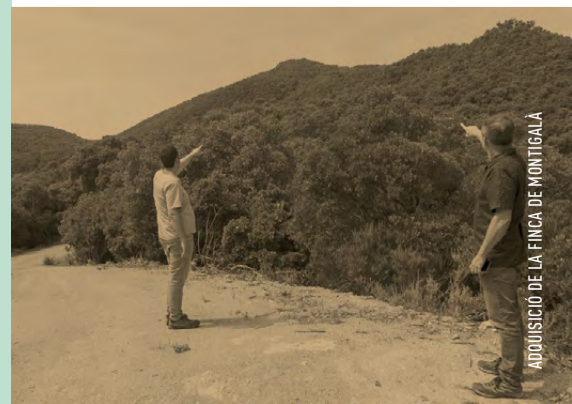
ADQUISICIÓ DE LA FINCA DE MONTIGALAR

56 ha | ADQUISICIÓ DE LA FINCA MONTIGALAR