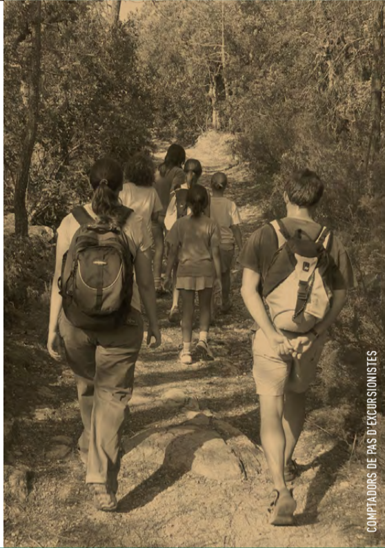
COMPTADORS DE PAS D'EXCURSIONISTES