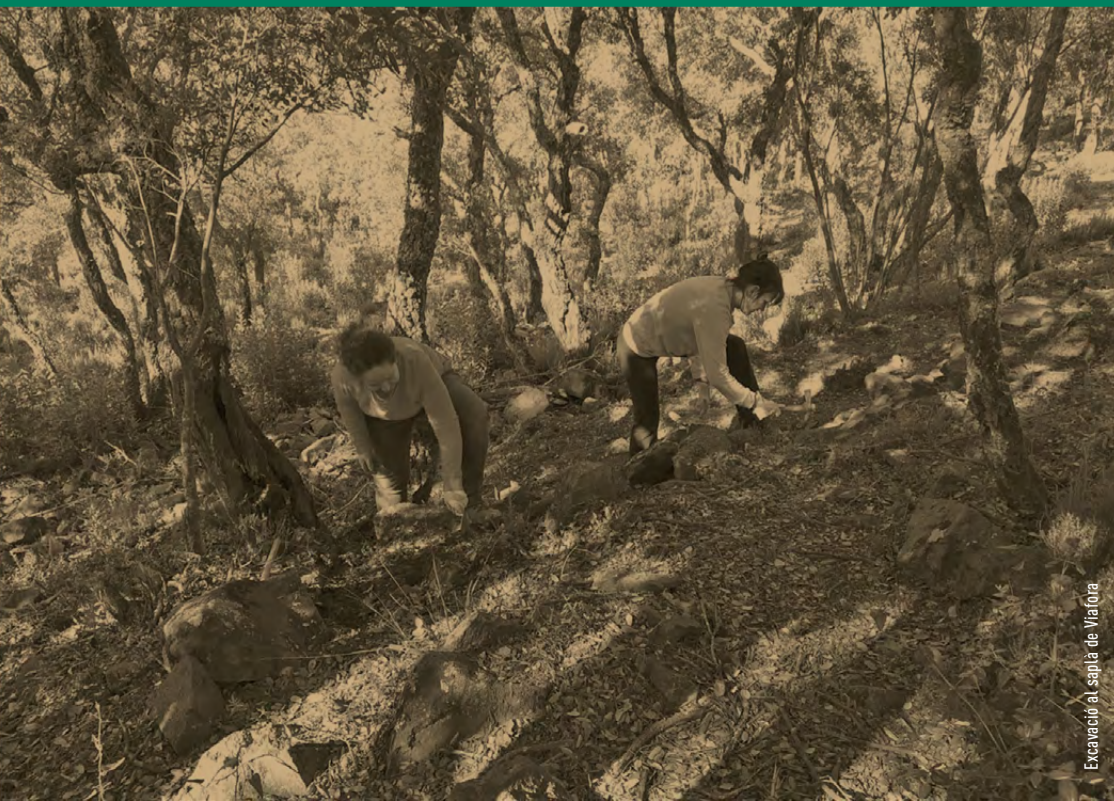
Excavació al capia de Vilafora