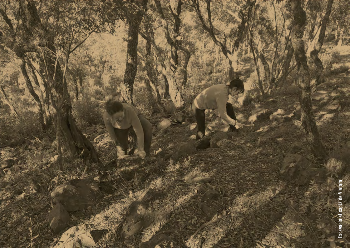
Excavació al capia de Vilafora