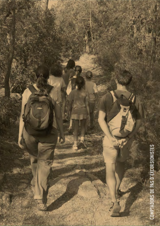
COMPTADORS DE PAS D'EXCURSIONISTES