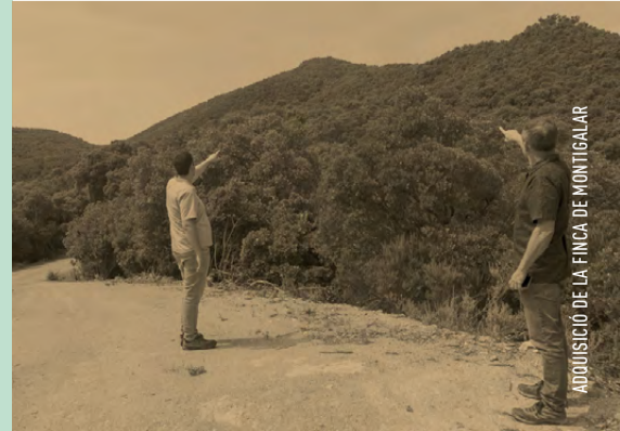
ADQUISICIÓ DE LA FINCA DE MONTIGALAR

56 ha | ADQUISICIÓ DE LA FINCA MONTIGALAR