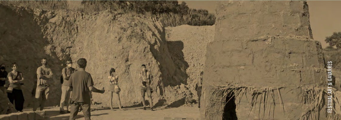
FESTIVAL ART & GAVARRES