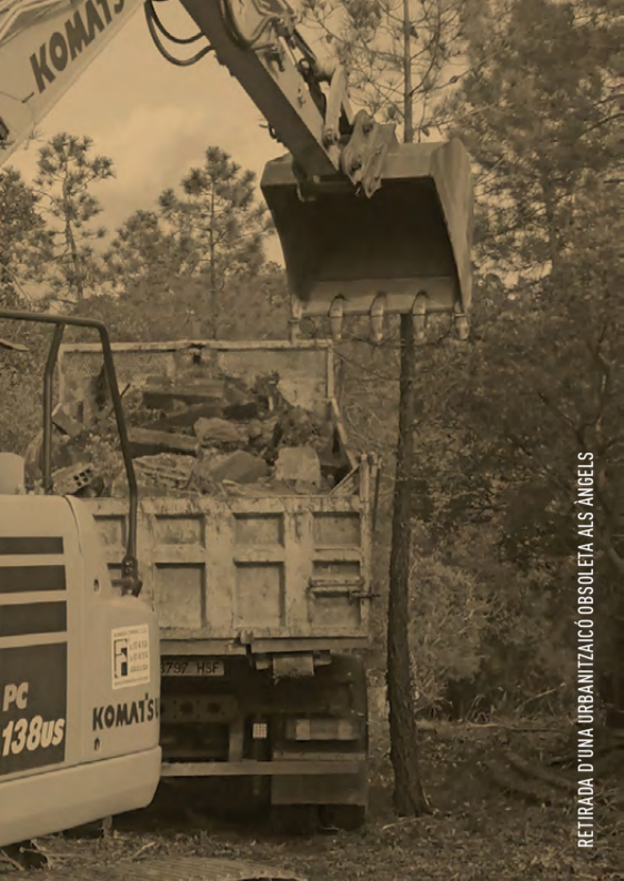
RETIRADA D'UNA URBANITZACIÓ OBSOLETA ALS ÀNGELS